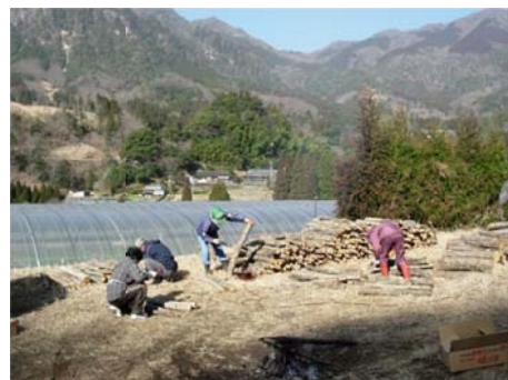
町内産の原木を使用した 椎茸コマ打ち作業