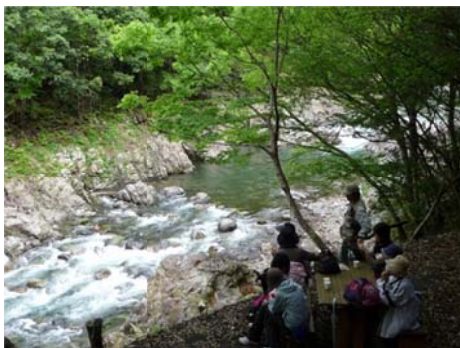
森林セラピー基地