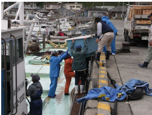
港での陸揚の様子