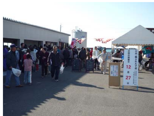
川内・甑とれたて市