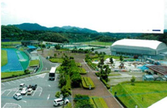
総合運動公園施設