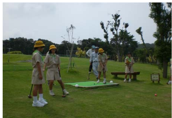
パークゴルフ大会(緑の少年団交流会)