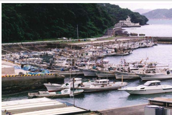
漁船で混雑する港