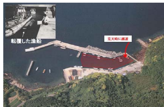
漁港施設の全体写真