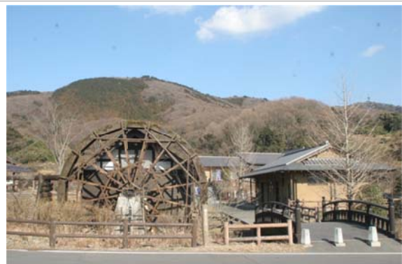
数々の小野小町伝説が残る小町の里