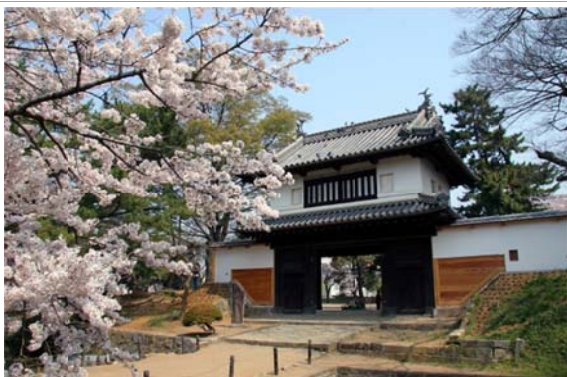
江戸時代前期建造で現存する 関東唯一の櫓門を有する亀城公園