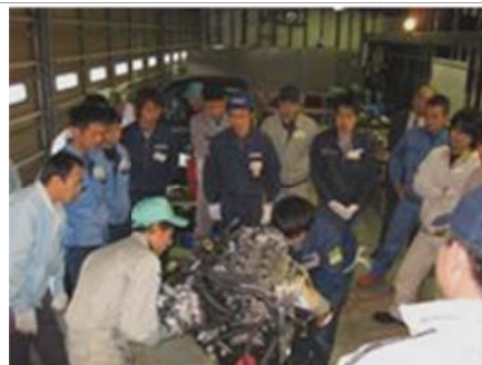
県内企業等を対象にした 自動車分解研修