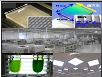
山形県内の先導的な研究成果