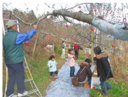
りんごオーナー制度