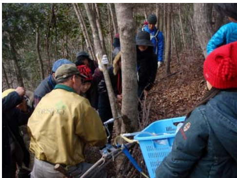
グリーンツーリズム (メープルシロップ採取体験)