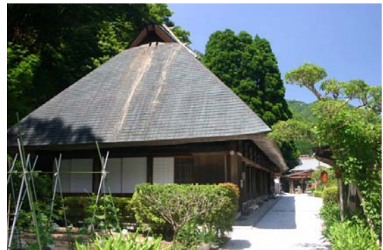
観光施設 (鶴富屋敷)