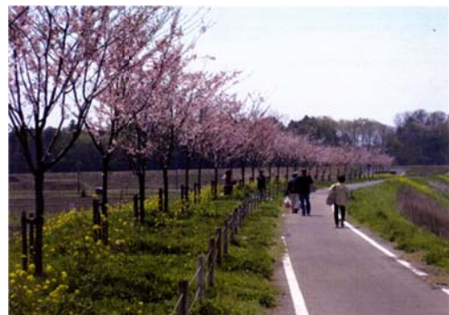
桜の里親制度によって 植栽された「思川桜」の様子