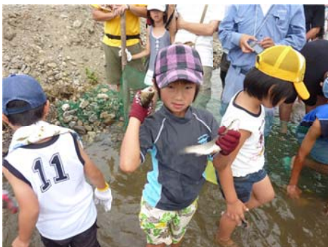
「アユまつり」でアユの つかみ取りに興じる子供たち