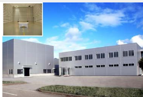
10m法電波暗室も備えた富山県ものづくり研究開発センター