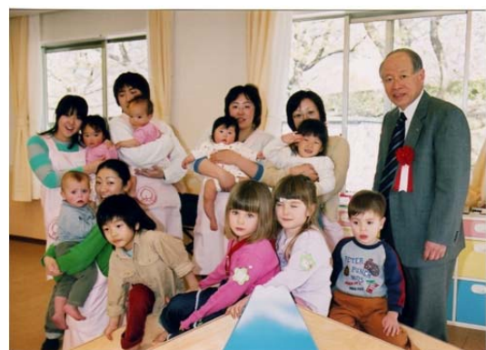
国際色豊かな事業所内託児施設