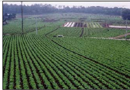
県内随一の農業生産額を誇る東総台地