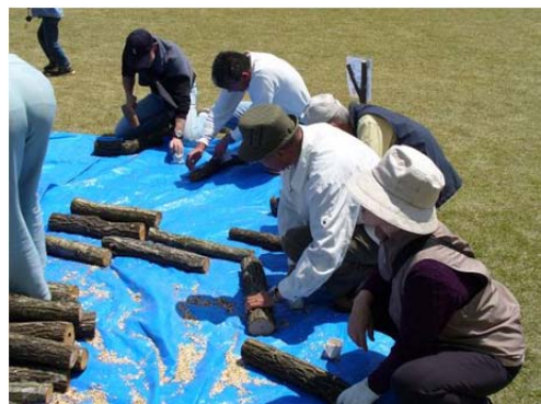
人と林産物の活性化「椎茸の原木植菌体験」