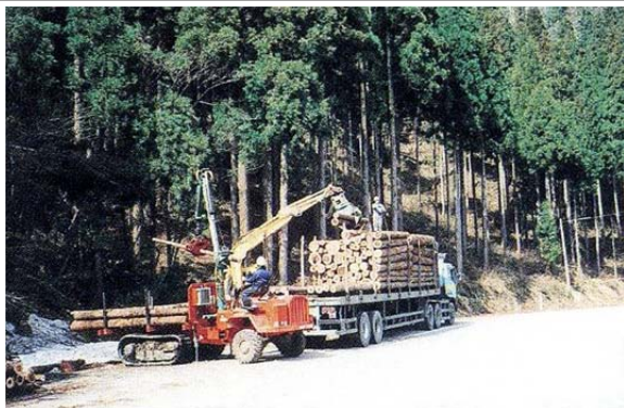
人と林産物の活性化「森林施業の状況」