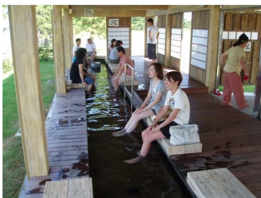
開湯1200年の歴史を誇る和倉温泉