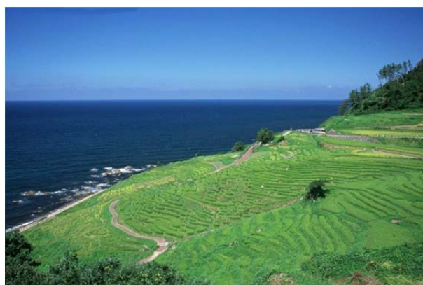
輪島市を代表する景勝地である千枚田