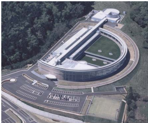
計画推進の中核となる 若狭湾エネルギー研究センター