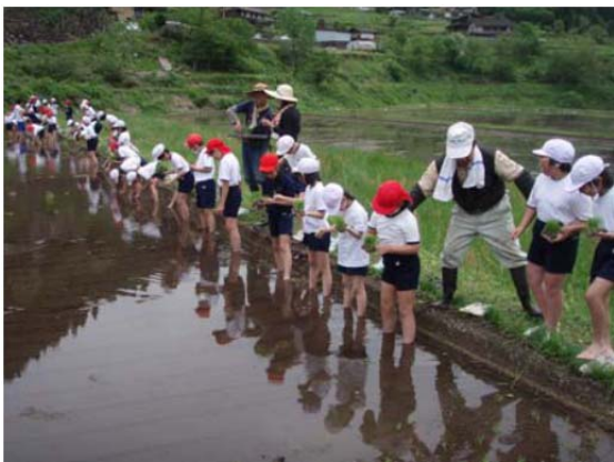
農業体験「都市小学生の田植え」