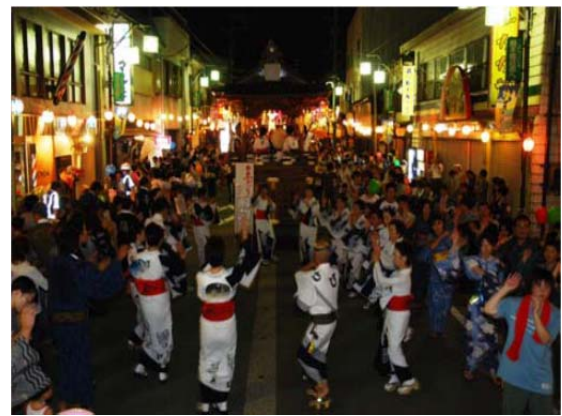
国選択無形民俗文化財「白鳥おどり」