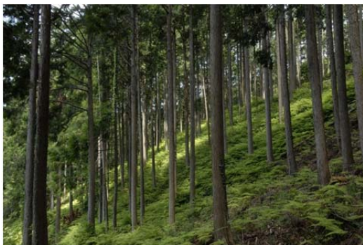
適正に管理の行き届いた森林