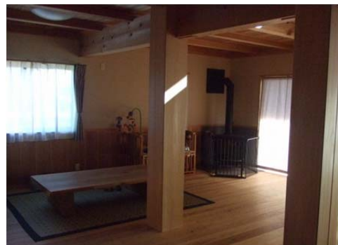
地元木材を使用して建築した木造住宅の家