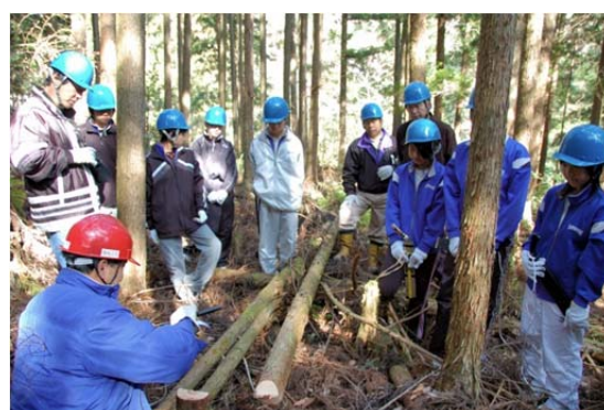
中学生を対象にした間伐講習