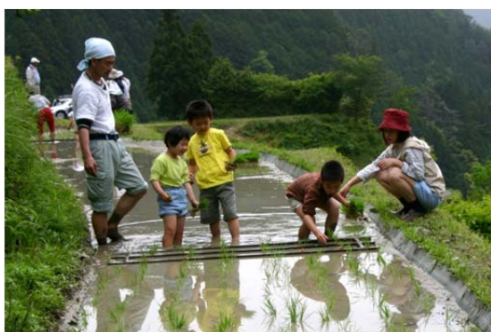
棚田オーナー制度による田植え