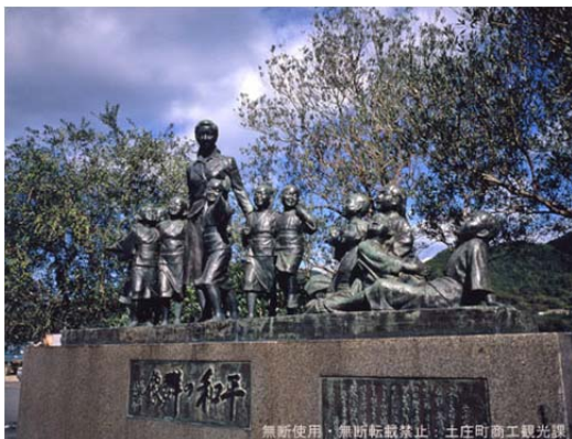
二十四の瞳・平和の群像