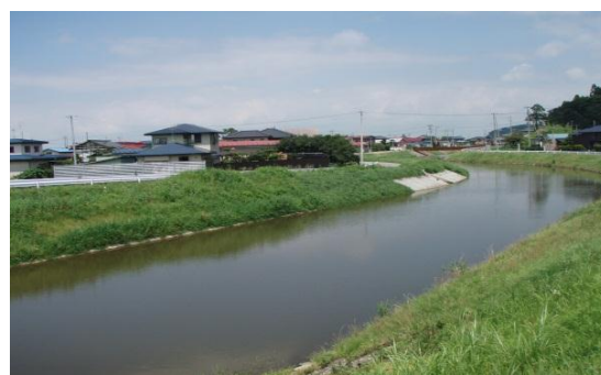
八郎湖へ流入する馬踏川