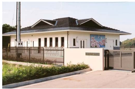
小山田甦水センター