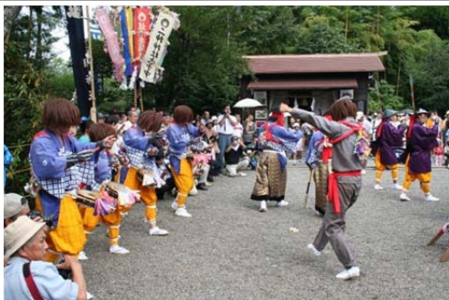
国無形文化財荒踊り