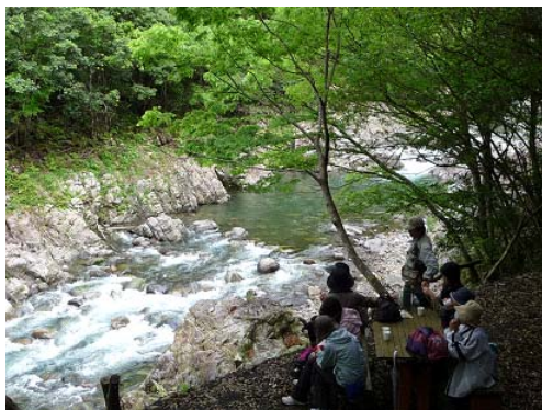
森林セラピー基地