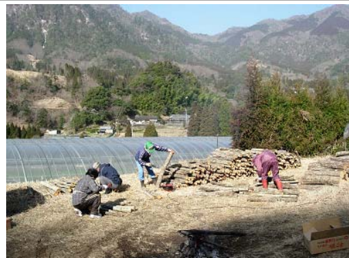
町内産の原木を使用した 椎茸コマ打ち作業