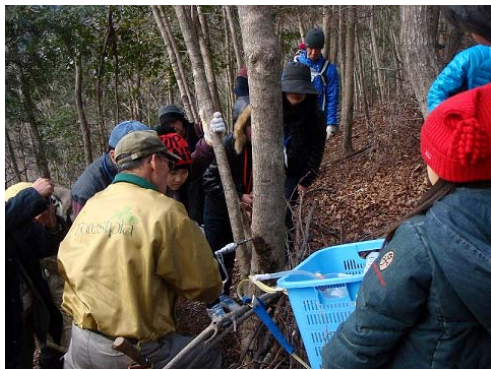
グリーンツーリズム (メープルシロップ採取体験)