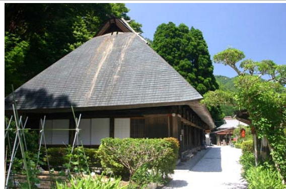
観光施設（鶴富屋敷）