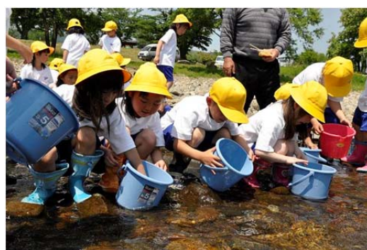
幼稚園児による鮎の稚魚放流