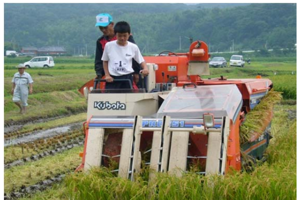
日本本土で一番早い超早場米「金峰コシヒカリ」の稲刈り風景