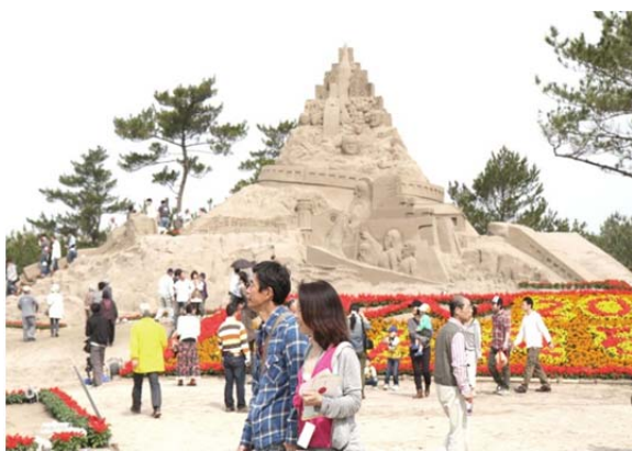
南さつま市最大のイベント「吹上浜砂の祭典」の会場風景 毎年20万人前後の来場者が来られます。