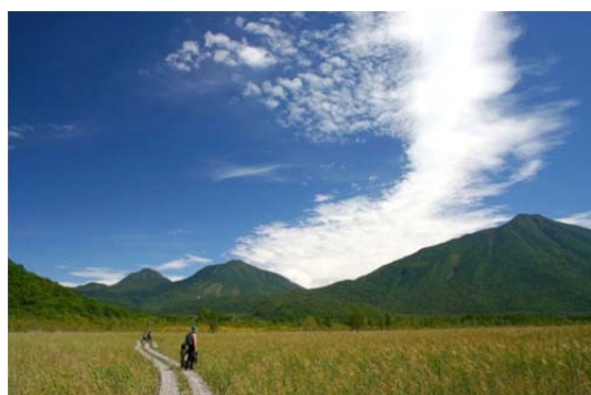
ラムサール条約登録湿地「奥日光の湿原」