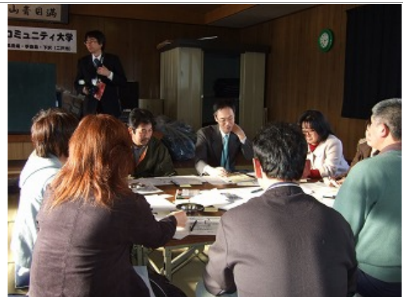
コミュニティ大学