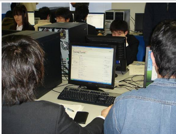
デジタル回路設計研修