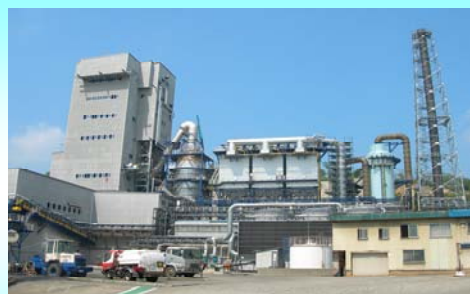
製錬所 リサイクル炉