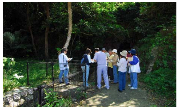
「人材育成講座」におけるフィールド調査