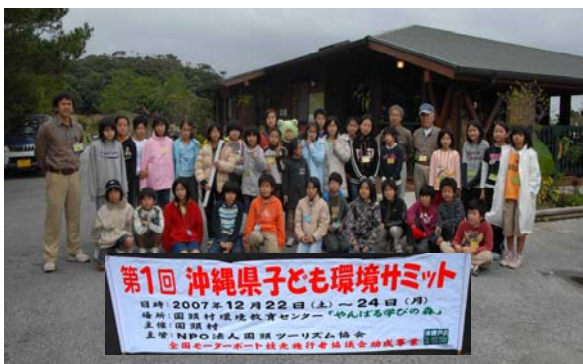
「第1回沖縄県子ども環境サミット」