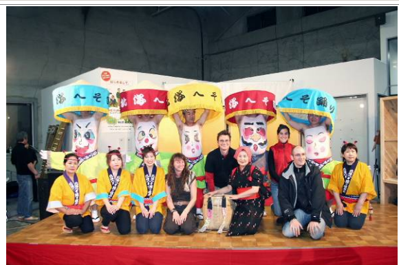
へそ踊りで歓迎 (国際交流イベント「ウェルカム・パーティ」)