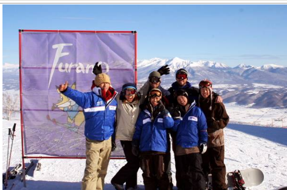
スキーを楽しむ豪州観光客とスキーホスト