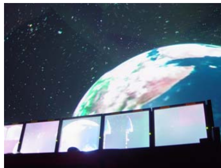
図1 国立天文台 4D2U の目標