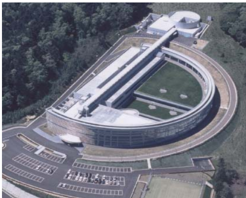
計画推進の中核となる 若狭湾エネルギー研究センター