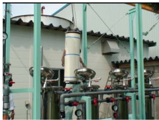
放射線技術を活用した金属吸着材開発