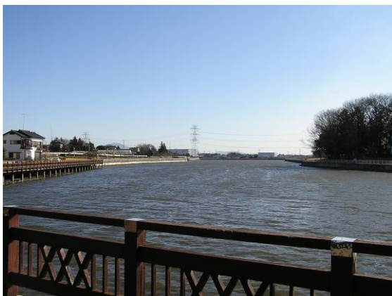
水とみどり交流拠点（親水公園）