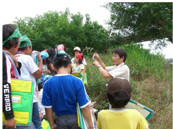
環境学習（古河市こども環境調査隊）