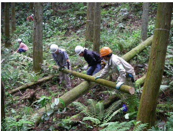
「森林ボランティア」