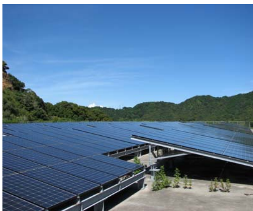
クリーンエネルギーのまちづくり (太陽光発電施設)