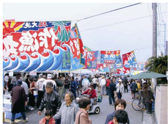
海の駅 須崎の魚まつり