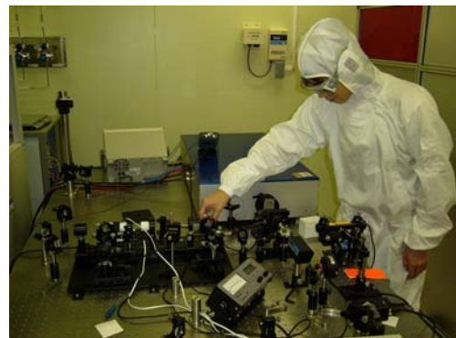
レーザ高度利用技術