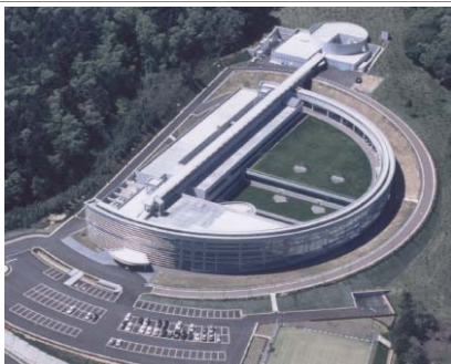
計画推進の中核となる 若狭湾エネルギー研究センター