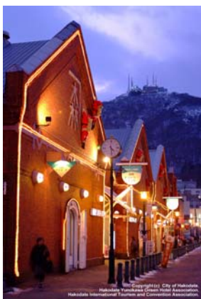
観光施設として生まれ変わった 歴史的建造物