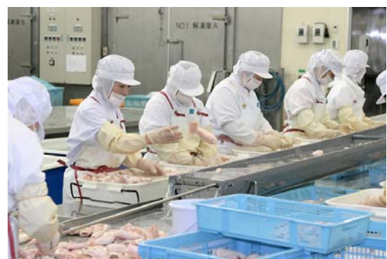
イカ加工品を製造する水産加工場