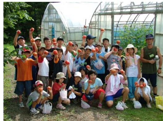
農業体験「とまと収穫」