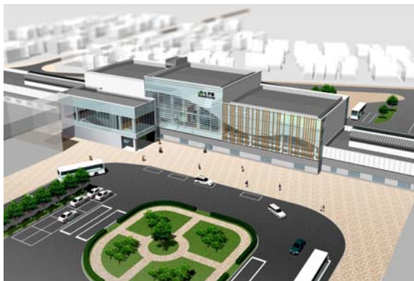
東北新幹線七戸（仮称）駅周辺イメージ図