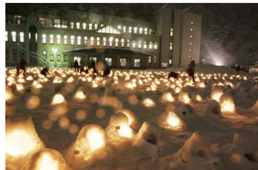
「かまくら祭」の様子