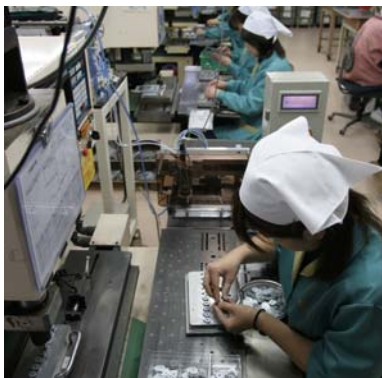
ものづくりの現場