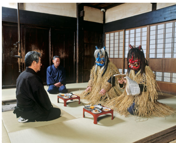
伝統行事 「なまはげ」