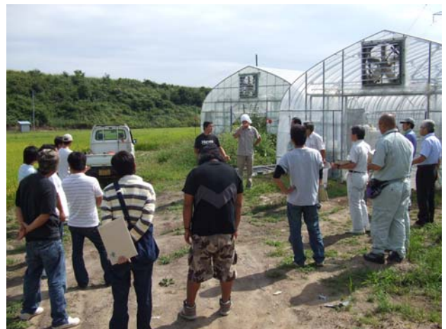
食農関連産業創出に向けた新たな産地形成のための現地研修