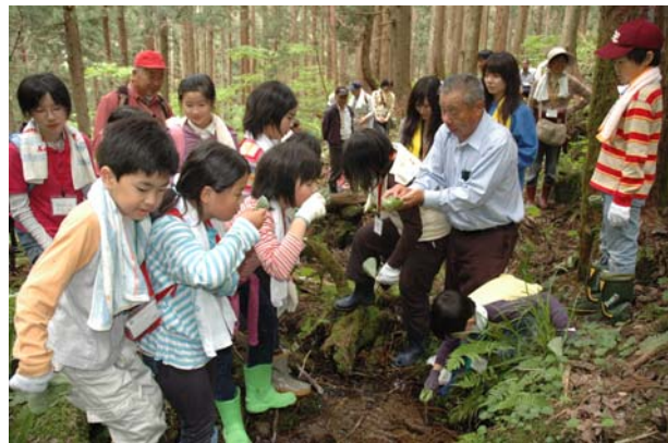
仙台圏交流キッズスクールの様子