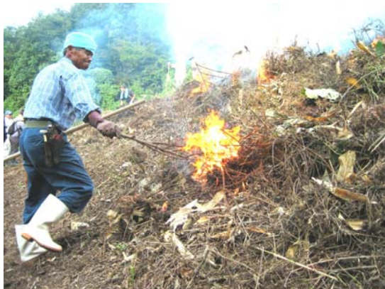
焼畑による農業生産