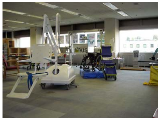
川崎福祉開発支援センター KIS 製品展示