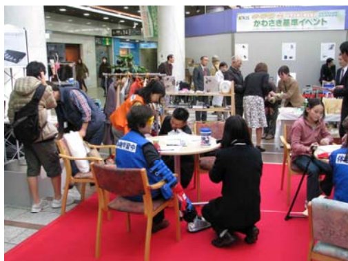
かわさき基準 福祉製品紹介イベント