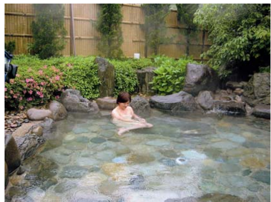
浜田市の温泉による癒し