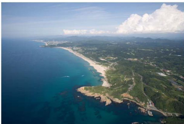
浜田市の美しい海岸線