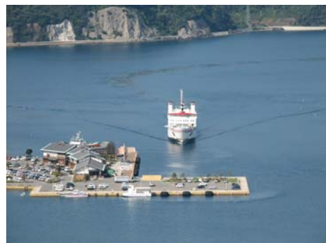
海士町の玄関口、菱浦港