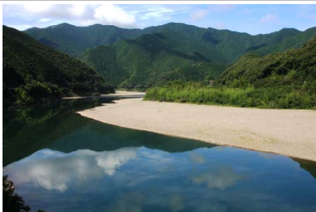
悠久の流れ 四万十川