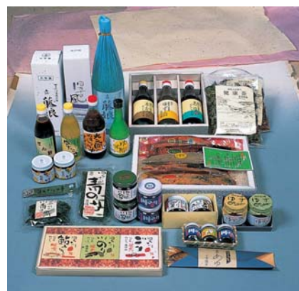
四万十市の特産品